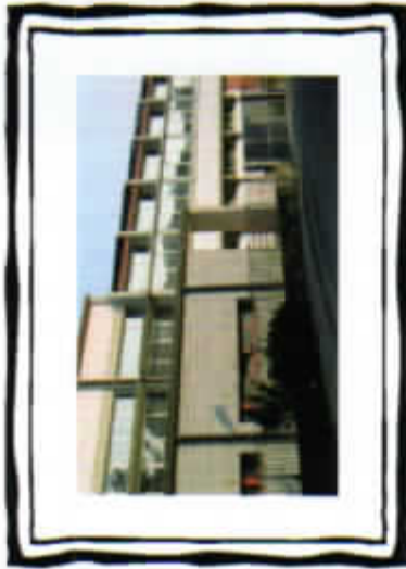
Palestre interne all'Istituto

Giornate di apertura della scuola: ☞ 04 dicembre 2010 ☞ 18 dicembre 2010 ☞ 15 gennaio 2011 ☞ 22 gennaio 2011 dalle ore 15.00 alle ore 18.00 Prima presentazione ore 15.30 Seconda presentazione ore 17.00