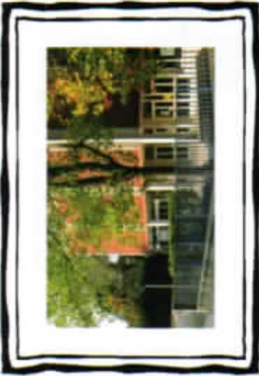
Sede dell' I. P. S. S. C.